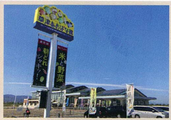
あおばな館 下笠町3203