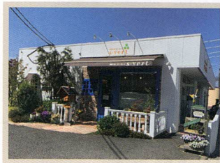
洋菓子工房 エス・ヴェール 志那中町33-5