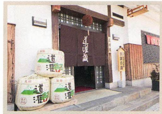
太田酒造株式会社 草津3丁目10-37