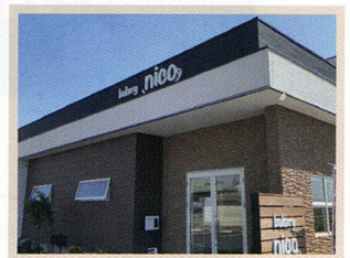
ベーカリーニコ 志那中町22-8