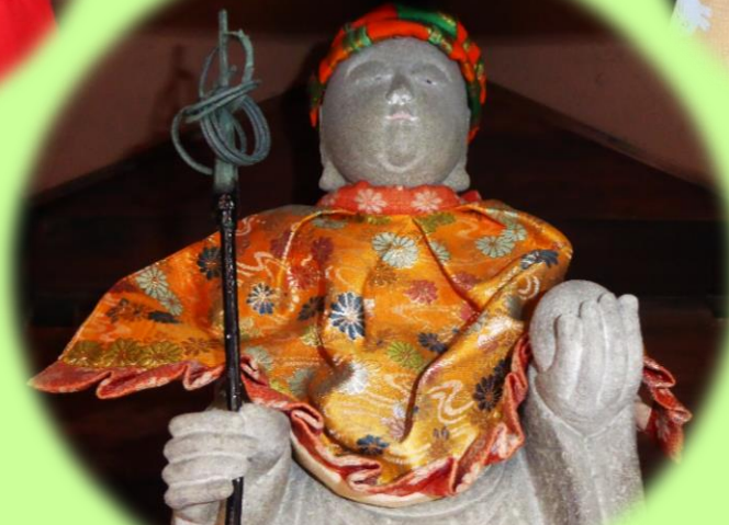
生栄じぞう尊(ホ久本地蔵尊写心)