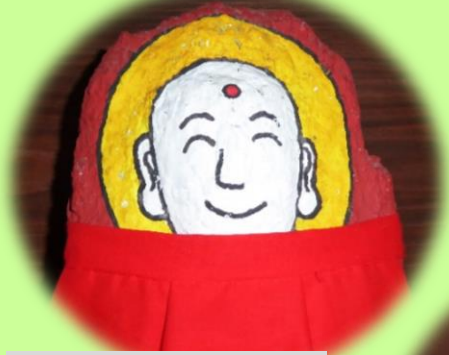
広小路他家じぞう尊