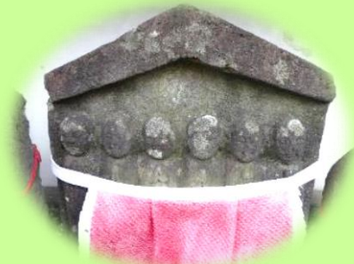
お跡じぞう尊(覚善寺境内)